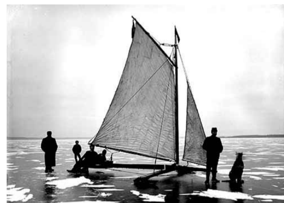
Fotograf: Didrik von Essen, 1904

Källa: www.hjulsbrovarvet.se Bild: www.skargardsbatar.se