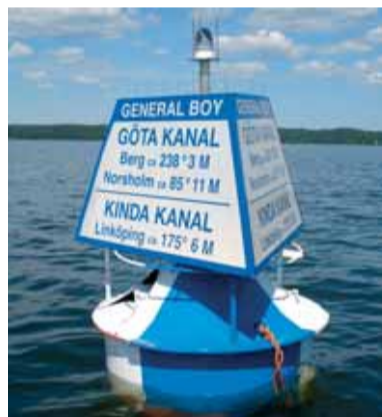
Bojen som Kinda Kanal och AB Göta kanalbolag placerat ut.

Segelkanot på Roxen 1948. På 40-talet fanns ett 20-tal ungdomar som tillbringade sin lediga tid i segelkanoter på Roxen.