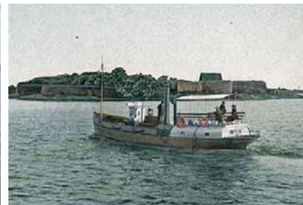
GENERAL BOY - ett av de första fartygen som trafikerade Kinda Kanal.