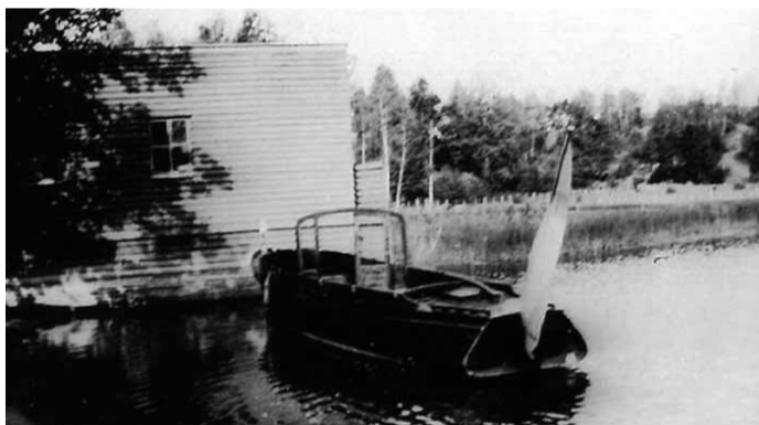
Privat fotografi, 1920-tal