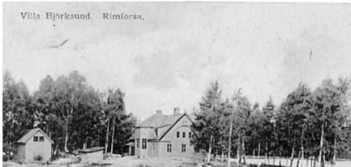
Okänd fotograf, 1913

Familjen Erikssons motorbåt vid båthuset.