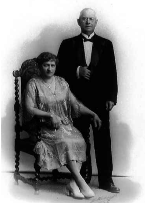
Privat fotografi, 1928

En tredje viktig uppgift är att bevara och utveckla fastigheten Björksund. I detta arbete ingår att sköta utemiljön så att den är tillgänglig och attraktiv för besökare och att återskapa bryggan och delar av trädgården. Huvudbyggnaden var från början gul med gröna detaljer.