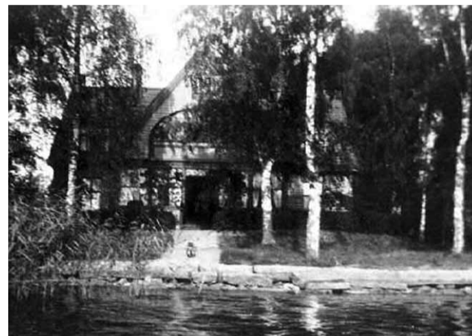
Privat fotografi, 1930-talet

Huset från sjösidan. På bilden ser man de många björkarna som växte på området kring huset och den vackra stenlagda kantlinjen mot sjön.