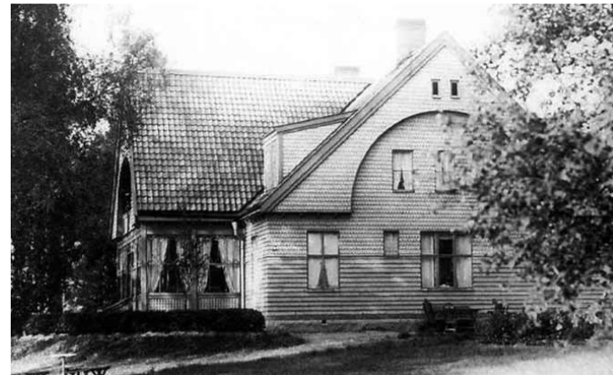
Privat fotografi, 1920-talet