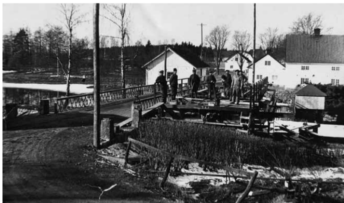
Joakim Johanssons arkiv

Kinda nedanför slottet på väg mot slussen.