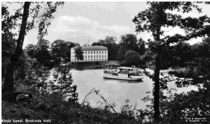
Kinda kanal. Brokind slott.

Örn var ett av Kinda Kanals största lastfartyg. Det skrotades 1934 nedanför nuvarande Drottningtornet i Linköping.