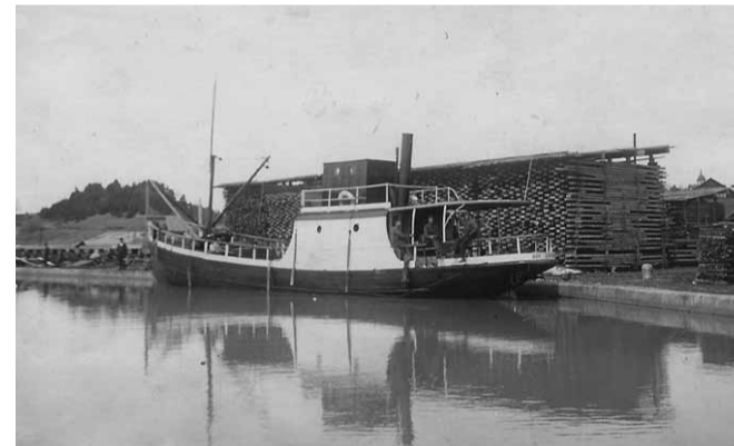
Joakim Johanssons arkiv

Ångfartyget byggdes i Göteborg år 1880 med namnet EJDERN och levererades till Göteborgs Nya Ångslups AB. I fartyget fanns plats för att ta 147 passagerare. EJDERN såldes 1898 till Linköping och Roxens Ångbåts AB. Hon trafikerade Roxens bryggor vid Berg, Sandvik och Grensholmen. Fartyget såldes våren 1906 till Södertälje Ångslups AB. År 1917 såldes hon till fartygets besättning. EJDERN togs ur bruk 1959 och övertogs av Södertälje stad. Hon fungerade ett tag som flytande väffelbruk och kafé. Efter 1964 bildades Skrufångfartyget EJDERN AB som övertog fartyget. Det blev sedan Museiföreningen Ångfartyget EJDERN. Hon återfick originalmaskineri och styrhytt och finns kvar i ursprungligt skick i Södertälje än idag.