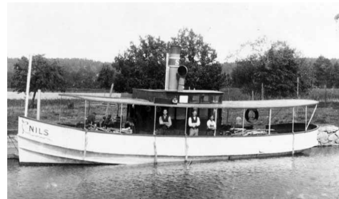
Joakim Johanssons arkiv

Det är okänt var fartyget kom ifrån. Det första kända om BOY finns i Linköpings hamnstyrelsens dagböcker från år 1887: "Ång. BOY ombyggd på slipern". Hon drog pråmar och fraktade virke på Kinda kanal. Båten hade endast en styrhytt akteröver, så när båten passerade Linköping skrek ungarna glåpor efter den: - Titta skithuset kommer! Fartyget registrerades först 1908 med Linköpings Transport & Trävarubolag som ägare. Hon hade byggts om i Söderköping år 1907 och fick en större överbyggnad. Från 1915 tillhörde hon Linköpings Förenade Rederi AB. 1926 blev hon såld till sju delägare som dessvärre fick fartyget bortsynt av fartygsinspektionen. Fartyget lades upp i Linköpings hamn efter säsongen 1926 och monterades ned. Vintern 1927-28 högs skrovet upp och blev vedbränsle. I Linköpings hamndagböcker står att BOY var nedskrotad den 31/12 1927.