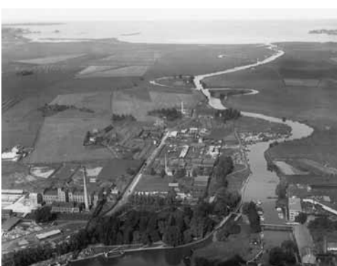
omkring 1930

Stångåns fortsättning på Kinda Kanal till Roxen.