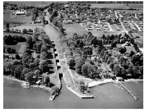
Fotograf: AB Flygfrakt, 1965

Den är placerad vid skärningspunkten för Göta och Kinda kanal.