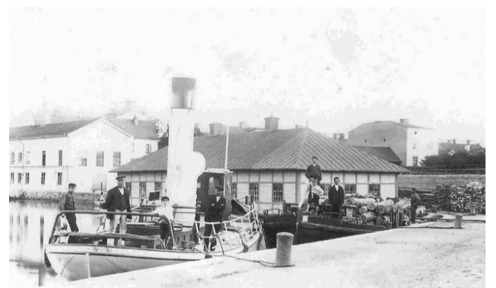
Joakim Johansson arkiv. 1910-tal

En av de viktigaste transporterna på Kinda Kanal var timmer. Det mesta fraktades på båt, men timmersläp förekom också.