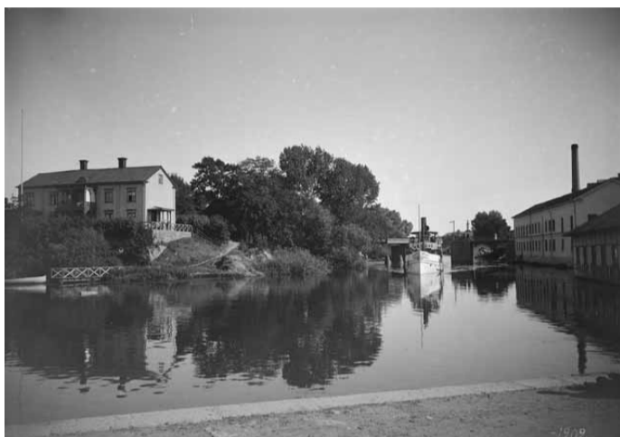
Fotograf: Didrik von Essen, 1902

Fartyget Brokind. Centralbryggeriets disponentbostad till vänster. Till höger Stångebro Nya Tvättinrättning som startades omkring år 1900 av fabrikör A. J. Nyström och hans maka. Från början utfördes hushållstvätt och herrtvätt samt strykning. Sedan år 1930 omfattade rörelsen även kemtvätt och färgeri.