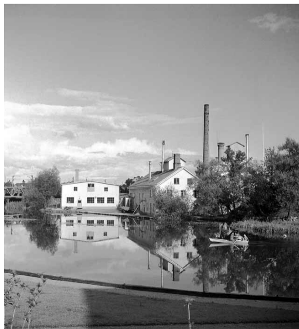
Fotograf: Arne Gustafsson, 1950-60-tal

Vy över Stångebro tvättinrättning, Stångebro och Hamngatan.