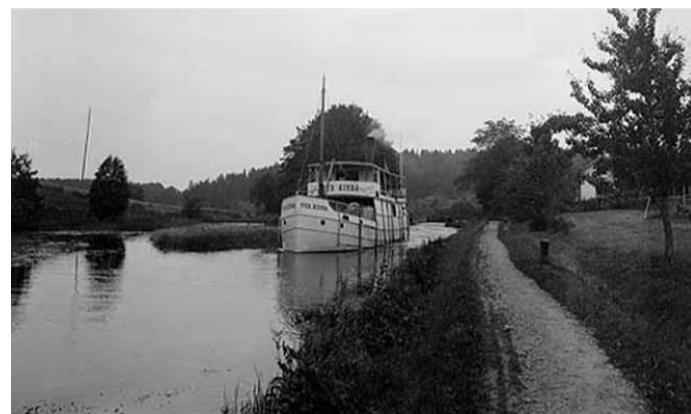
Fotograf: Johan Emanuel Thorin, 1919 Nya Kinda vid Hamra.