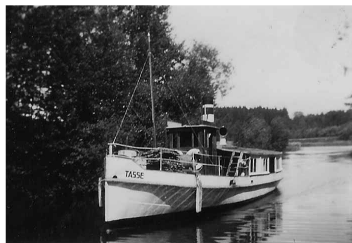
Bogseraren Tasse nedanför Hamra, 1940-tal.