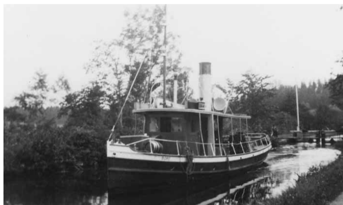
Bogseraren Bore ovanför Hamra sluss, 1940-tal.