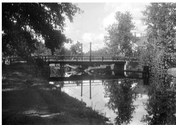
Fotograf: Johan Emanuel Thorin, 1919 Kanalbron vid Hamra sluss.