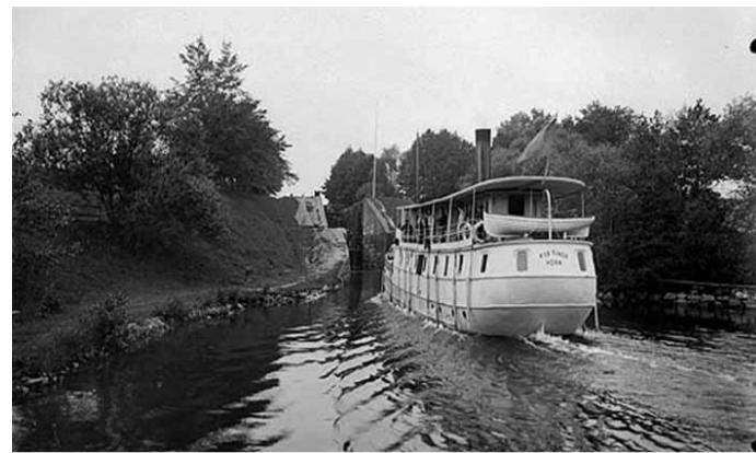
Fotograf: Johan Emanuel Thorin, 1919 Nya Kinda vid Hamra.

Hamra slussar ligger i Vist socken. När Kinda Kanal anlades var det för svårt att anlägga en kanal i den naturliga delen av Stångån förbi Bjärka Säby. Istället grävdes under 1860-talets slut en 6 km lång kanal från sjön Stora Rengen förbi Hovetorp gård för att så ansluta till Stångån. Denna grävda kanalsträcka har en nivåskillnad på 25 meter och sex slussteg. Hamra har två slussteg med en nivåskillnad på 8,9 meter. Hamra slussvaktarstuga byggdes 1870. När kanalen grävdes var kanalbolaget tvungna att anlägga en svängbro ovanför slussen där landsvägen gick fram. På norra sidan av denna landsvägsbro ligger Hamralund som var handelsbod under 1900-talets börjar. På 1960-talet byggdes den nya vägsträckningen och den fasta betongbron strax ovanför slussen byggdes. På de gamla ångbåtarnas tid steg passagerare ofta av vid slussen och tog en promenad längs den gamla dragvägen till nästa sluss i Hovetorp.