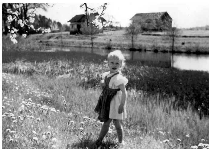
Hamra slussvaktstuga i bakgrunden, 1953.