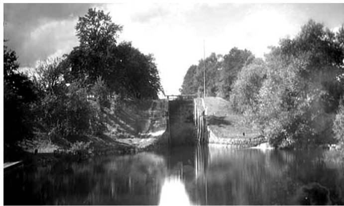
Nedersta slussen i Hamra, augusti 1919.

Hamra slussar ligger i Vist socken. När Kinda Kanal anlades var det för svårt att anlägga en kanal i den naturliga delen av Stångån förbi Bjärka Säby. Istället grävdes under 1860-talets slut en 6 km lång kanal från sjön Stora Rengen förbi Hovetorp gård för att så ansluta till Stångån. Denna grävda kanalsträcka har en nivåskillnad på 25 meter och sex slussteg. Hamra har två slussteg med en nivåskillnad på 8,9 meter. Hamra slussvaktarstuga byggdes 1870. När kanalen grävdes var kanalbolaget tvungna att anlägga en svängbro ovanför slussen där landsvägen gick fram. På norra sidan av denna landsvägsbro ligger Hamralund som var handelsbod under 1900-talets börjar. På 1960-talet byggdes den nya vägsträckningen och den fasta betongbron strax ovanför slussen byggdes. På de gamla ångbåtarnas tid steg passagerare ofta av vid slussen och tog en promenad längs den gamla dragvägen till nästa sluss i Hovetorp.