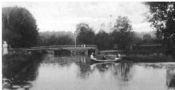
Gamla landsvägsbron vid Hamra.