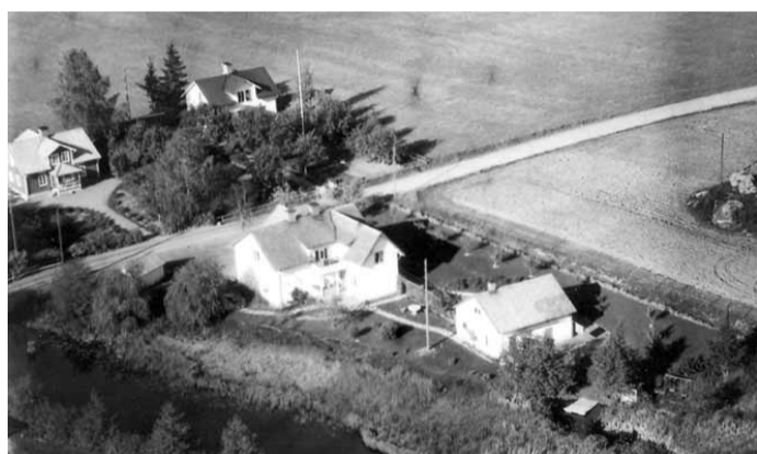
Handelsboden Hamralund, 1953. Affären fanns mellan 1890 och 1969.