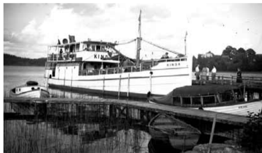
Rimforsa Foto, 1950-tal

Passagerarfartyget Kinda vid Hovby brygga.