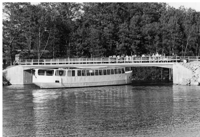
Fotograf: Stig Berg, 1960-tal, Kinda Lokalhistoriska Arkiv