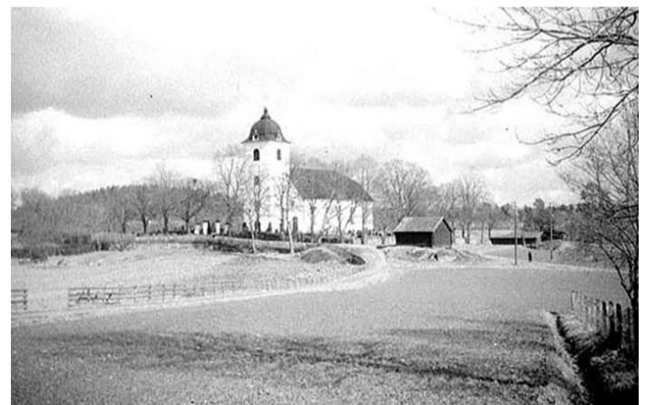
Fotograf: Bengt Chattingius, 1945

"Sägner förmälde att Nils Dacke vid tiden för striden här (hvarom mera längre fram) bott i en stuga som ännu finnes kvar vid gårdsplanen, och att egaren af Hovby därför låtit