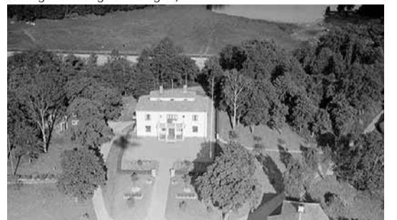
Fotograf: AB Flygfrakt, 1935