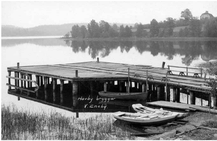
Kinda lokalhistoriska arkiv

Hovby brygga med gården Näs i bakgrunden.