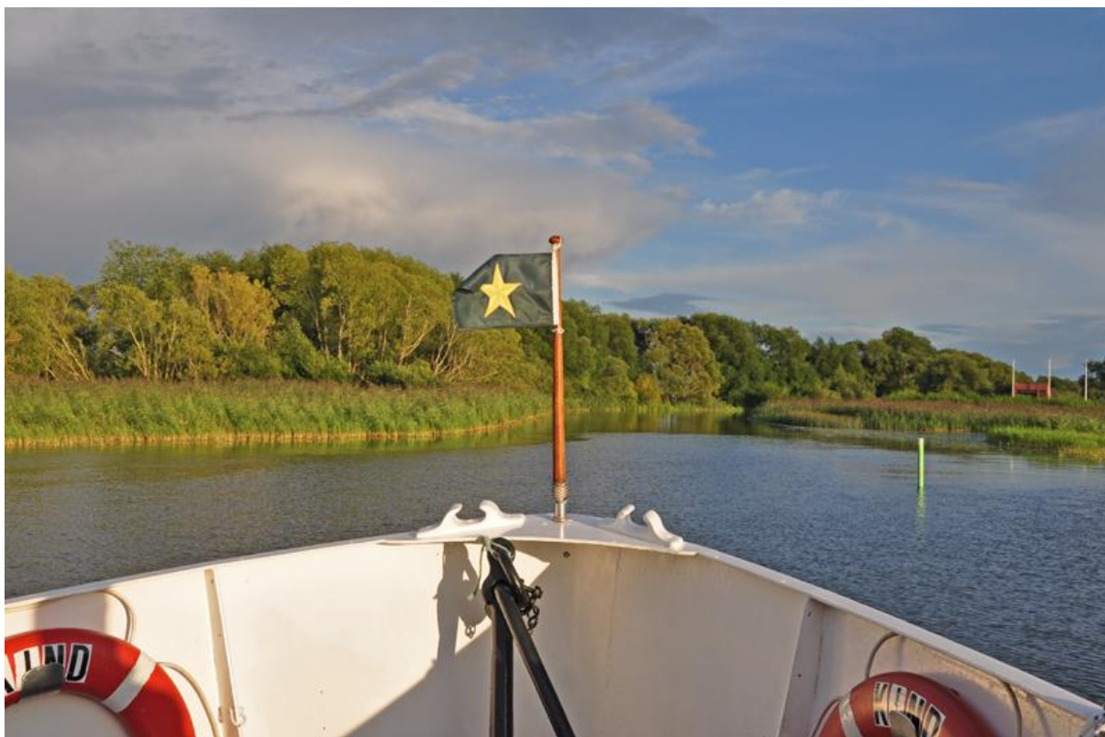
Fören vändes tillbaka till det "Amazonas" som sträckan från åmynningen vid Roxen upp mot motorbåtshamnen ofta liknas med.