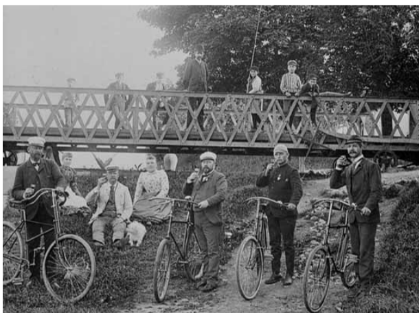
Cykeltur till Nykvarns sluss.