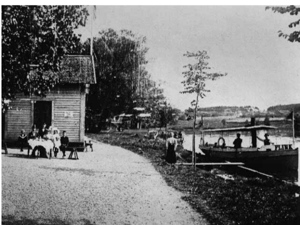
Okänd fotograf, 1890 Brunnssalongen vid Ladugårdskällan.