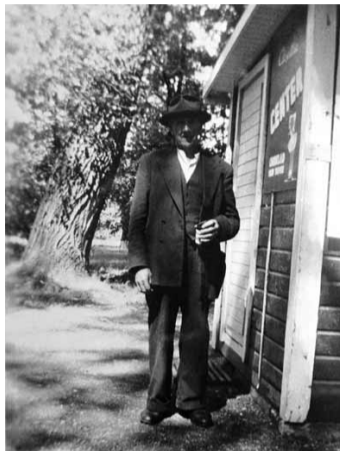
Okänd fotograf, 1950-talet Dricker en Pilo vid kiosken i Nykvarnsparken.