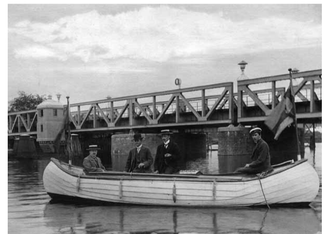
Okänd fotograf, 1917 En tur med fritidsbåten.