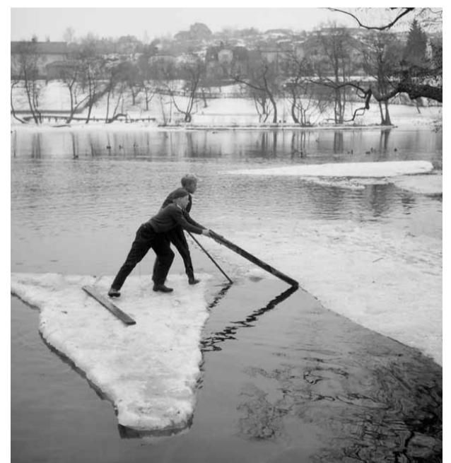
Fotograf: Arne Gustafsson, 1950-tal Lek på isflak.

Utställningen är finansierad av Westman-Wernerska stiftelsen och sammanställd av AB Kinda Kanal i samarbete med: