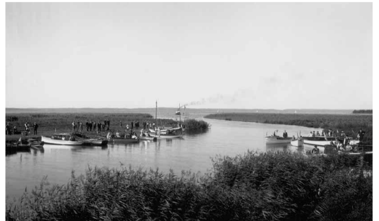
Fritidsbåtar vid ämynningen.