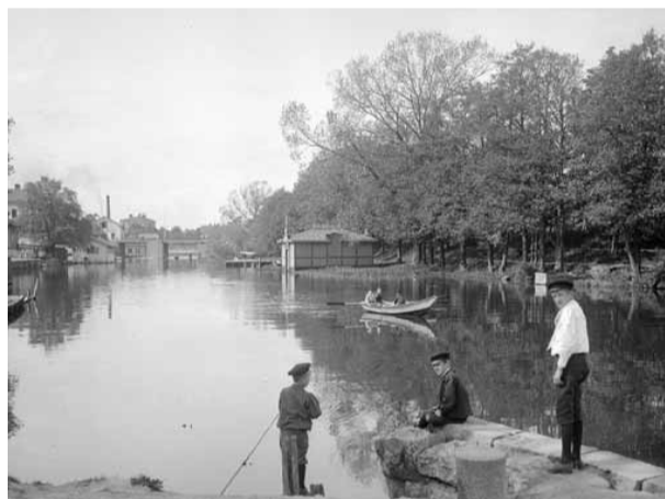
Fotograf: Lars Fredrik Lovén, 1921 Att meta har varit en populär sysselsättning för många generationer Linköpingsbor.