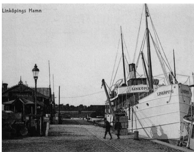
Okänd fotograf 1910-tal

Fartyget byggdes år 1896 i Stockholm. Hon sattes i trafik samma år på Kinda Kanal med namnet NYA KINDA. År 1912 såldes NYA KINDA till Haparanda och Torne älv och omdöptes till SESKARÖ. År 1917 blev hon ombyggd till bogserfartyg och fick namnet NORD. Mellan åren 1938-56 ägdes hon av svenska staten och tillhörde försvarvet. År 1976 avfördes hon ur fartygsregistret och "lär ha huggits upp i Ekenberg".