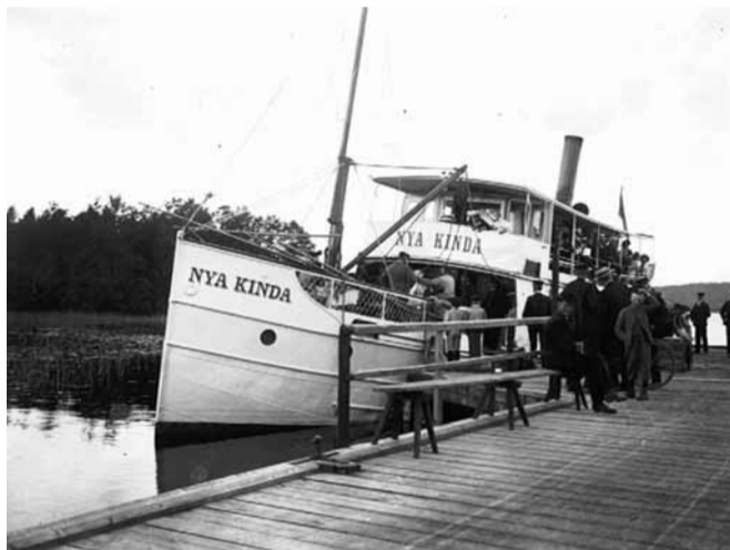
Vid Hovby brygga 1909

Fartyget byggdes år 1913 i Göteborg med namnet KIND. Hon insattes i trafik på sjön Åsunden i samtrafik med Östra Centralbanan så att man smidigt kunde byta från järnväg till båt. Hon trafikerade sjöarna Åsunden och Åmmern till 1924. År 1925 hamnade hon i Stockholm med namnet TOR V. 1938 ändrades namnet till FYLGIA. Båten blev filmstjärna 1939 i den svenska pilsnerfilmen "Sjöcharmörer" för tillfället omdöpt till HERKULES. Artisten Lasse Dahlqvist spelade båten kapten. Noteras bör att det på skeppsklockan som hängde ovan Lasse Dahlqvists huvud fortfarande stod "KIND 1913". År 1959 hamnade hon i Göteborg och ombyggdes till vattenbåten HALLABALO. Hon fanns kvar i början av 1990-talet som rostigt monument.