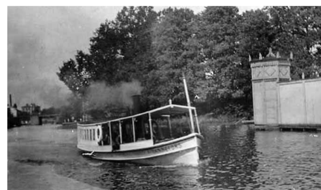
Okänd fotograf 1910-tal

Fartyget byggdes år 1907 i Karlstad och gick som bogserfartyg i norra Vättern som HARGE (II). År 1938 hamnade hon i Motala och fick namnet WULF. År 1958 byggde hon om till passagerarfartyg med namnet KIND. Hon trafikerade Kinda Kanal endast en säsong från den 22 maj till den 30 augusti 1959. Fartyget ansågs för obekvämt och såldes redan samma höst till Stockholm. Hon fick namnet ändrat till BLIDO, och senare till RAN-NICK. I slutet av 1980-talet fick hon ett värdigt utseende genom en fullständig restaurering till sitt originalutseende igen samt återdöpt till HARGE med hemmahamn i Smedjebacken i Dalarna.