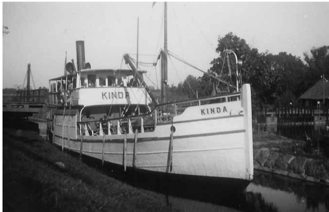
Vid Slattefors 1940-tal

Fartyget byggdes år 1890 vid Södra varvet i Stockholm som sjöängsprutan PHOENIX och tillhörde Stockholms brandförvar. Fartyget var stationerat till Stockholms skärgård. PHOENIX såldes till Motala 1959 och byggdes om till passagerarfartyg för Kinda kanal. År 1960 sattes hon in i trafik under namnet KIND. KIND är det tredje fartyget med det namnet på Kinda Kanal, men hon är det äldsta av dem alla.