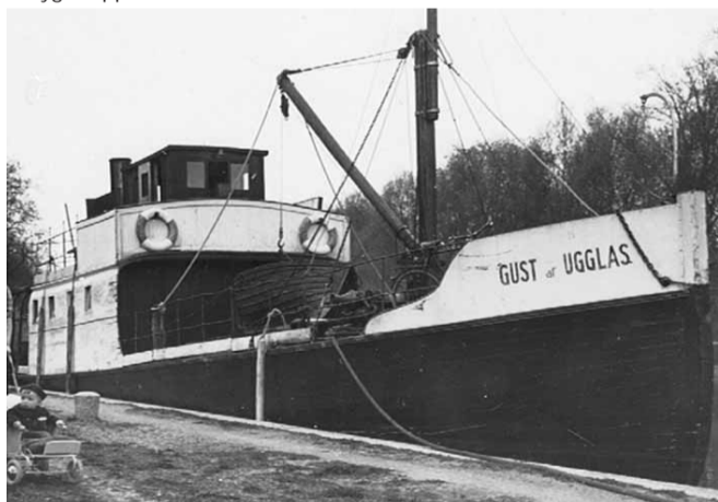
I Linköpings hamn 1940-tal

Det fartyg som många generationer linköpingsbor förknippat med Kinda Kanal är gamla kära trojkanaren KINDA. Ett passagerarfartyg som trafikerade kanalen i otroliga 85 år, rekord för Kinda Kanal. Fartyget byggdes år 1872 i Söderköping som lastfartyget BJÖRKFORNS N:o 1. Fartyget fick våren 1888 det nya namnet KINDA. Hon fortsatte att gå som lastfartyg men tog även passagerare. Från 1913 var KINDA det enda passagerarfartyget på Kinda Kanal. Förutom passagerare fraktades även annat gods. KINDA var på 1940-talet Sveriges äldsta träångfartyg, men motoriserades 1951. KINDA gjorde sin sista tur den 30 augusti 1957. Det var Tullbron i Linköping som satte stopp för alla högre båtar. Fartyget såldes till Norrköping och fungerade som husbåt med namnet LINDA. År 1977 brändes fartyget upp.