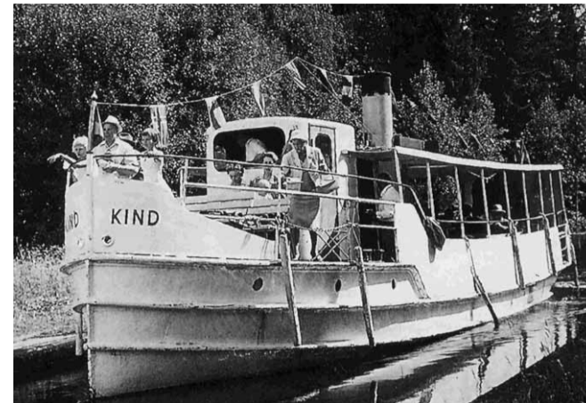
Joakim Johanssons arkiv. 1959

Fartyget byggdes år 1903 i Stockholm. År 1904 insattes hon med namnet LINKÖPING på ruten mellan Linköping, Nyköping och Stockholm. Fartyget hade tre föregångare med samma namn. Förutom passagerare fraktades gods. Med i lasten fanns ibland även bilar. Passagerarfartyget LINKÖPING seglade sin sista säsong 1938. Ett annat fartyg med namnet LINKÖPING sattes in på samma rutt innan trafiken upphörde 1946. Således har fem fartyg med namnet LINKÖPING trafikerat samma rutt från 1846-1946. 1903 års LINKÖPING fick senare namnet EKERÖ och skrotades 1982. Skeppsklockan hänger i Tannefors slusscafé.