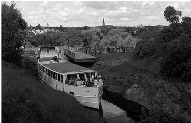
1960-tal vid Tannefors sluss

Ett urval av de passagerarfartyg som trafikerat Linköpings hamn