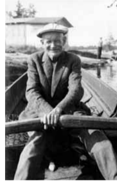
Kinda lokalhistoriska arkiv

Från omkring 1930 var han fast boende på den lilla kobben Fläsklösen i Järnlunden. Den kur som han dragit ut över isen på medar byggdes med tiden ut och var vid sin fulländning "fyra rum och