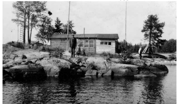
Kinda lokalhistoriska arkiv

Leif Wallentinsson, Östergötlands länsmuseum, maj 2007