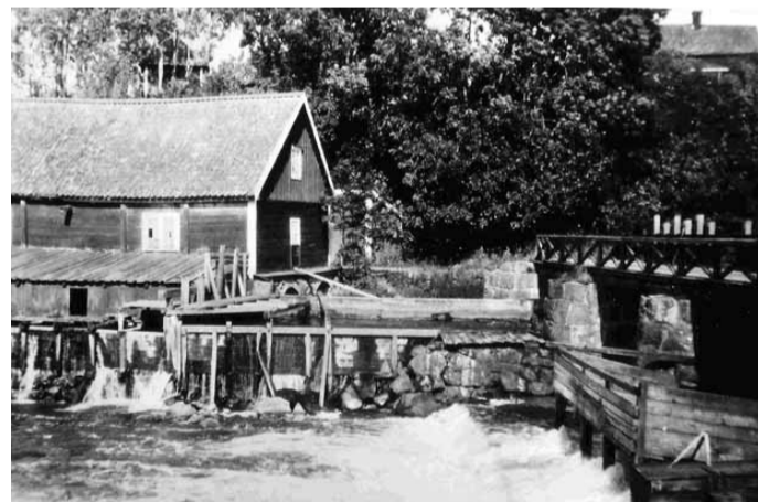
Landeryds Hembygdsförenings arkiv