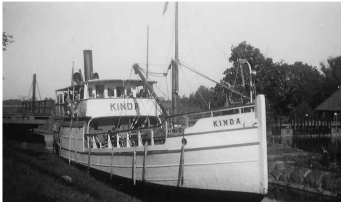
Joakim Johanssons arkiv