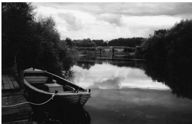
Fotograf: Joakim Johansson, 1999

Text: Joakim Johansson, Landeryds hembygdsförening