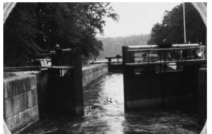
Sturefors sluss, 1940-tal.