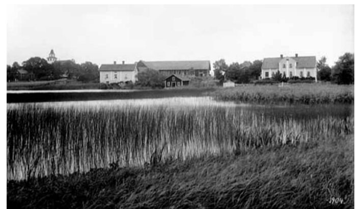
Fotograf: Didrik von Essen, 1904 Byggnader och kyrka sedda från en vassrugge.

För mer information kontakta Sturefors Godsförvaltning AB 013-251 49.