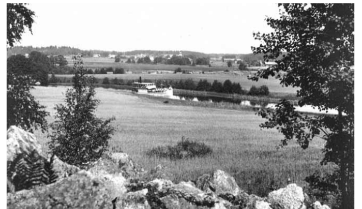
Utsikt över Stångådalen med Vist kyrka.