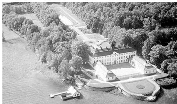
Fotograf: AB Flygfrakt, 1961