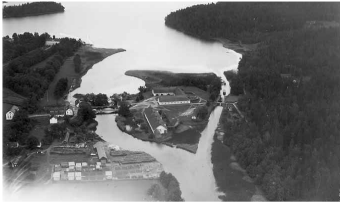
Flygfoto 1928.

Slussen är en enkelsluss med en nivåskillnad på 3,2 meter. Slussvaktarstugan är bevarad i sitt ursprungliga utseende sedan 1871. Över kanalen går en rullbro av järn. Samhället Sturefors med Prästgårdskajen är beläget ca 4 km väster om slussen. Slussen anlades inte vid forsens utan vid ett mindre bäckflöde som breddats. Förr utnyttjades forsarna till att driva kvarnar, nu finns här ett kraftverk. Här finns Stångåns och Kinda Kanals utflöden i Ärlången.