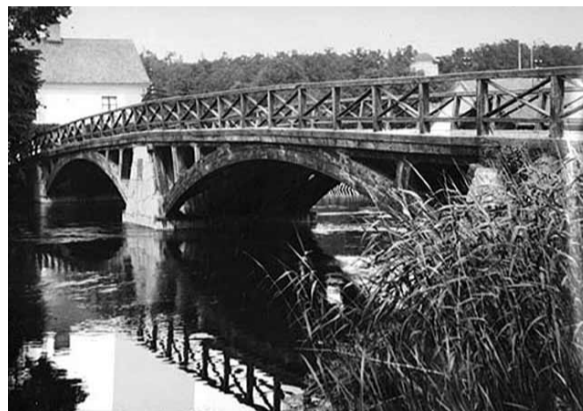
Gamla träbron i Sturefors.