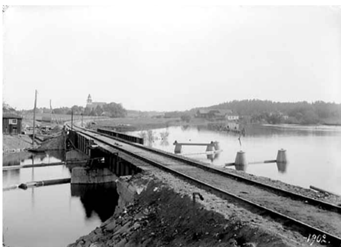
Fotograf: Didrik Von Essen, 1900 Järnvägsbron vid Sturefors med Vist kyrka i bakgrunden.