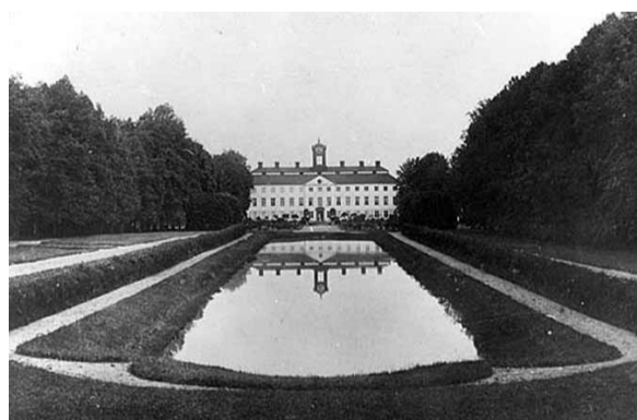
1900 Sturefors slott.