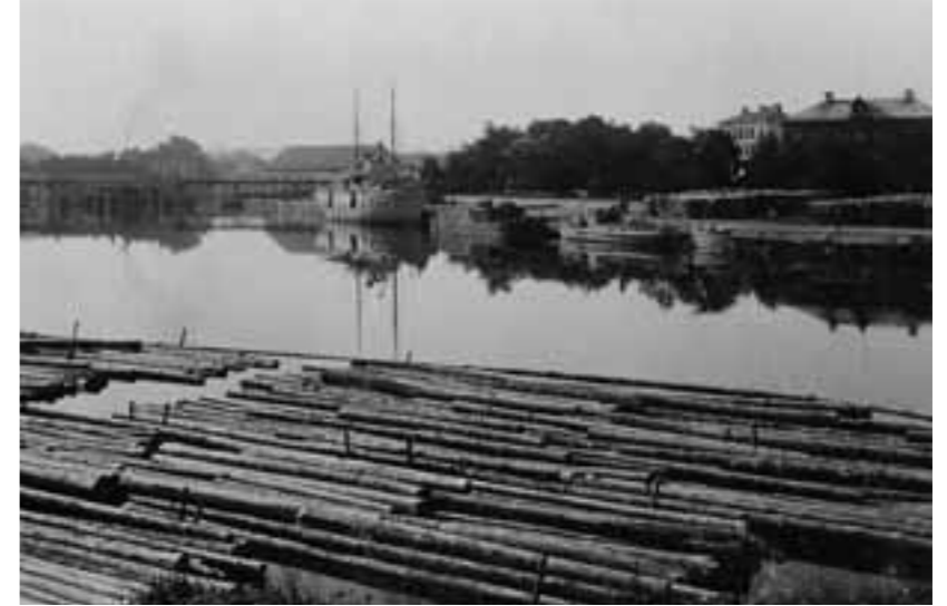
omkr. 1920 Timmer i hamnen.

Tillkomsten av Göta kanal och Kinda kanal samt muddringen av inseglingsvägen från Roxen hade möjliggjort att utnyttja vattenvägarna. Allehanda varor kom att skeppas till och från Linköpings hamn. Långväga såväl som lokala persontransporter förekom också på vattnet.