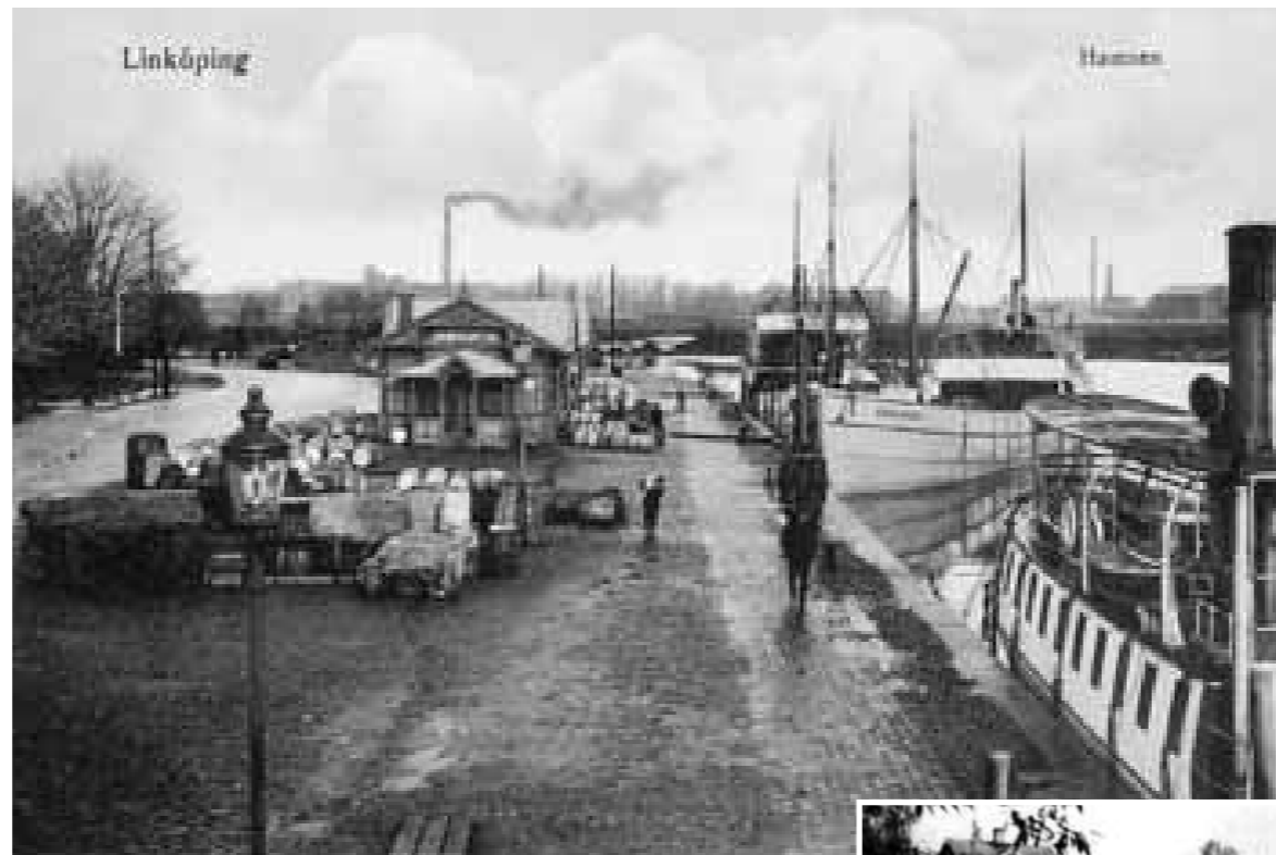
Okänd fotograf Linköpings hamnkontor.