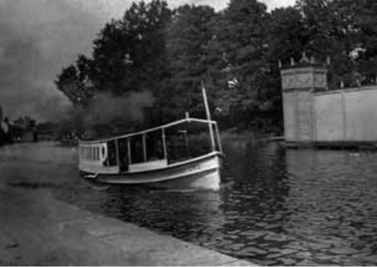
Okänd fotograf, 1910-tal Ångslupen Tannefors.

Tillkomsten av Göta kanal och Kinda kanal samt muddringen av inseglingsvägen från Roxen hade möjliggjort att utnyttja vattenvägarna. Allehanda varor kom att skeppas till och från Linköpings hamn. Långväga såväl som lokala persontransporter förekom också på vattnet.