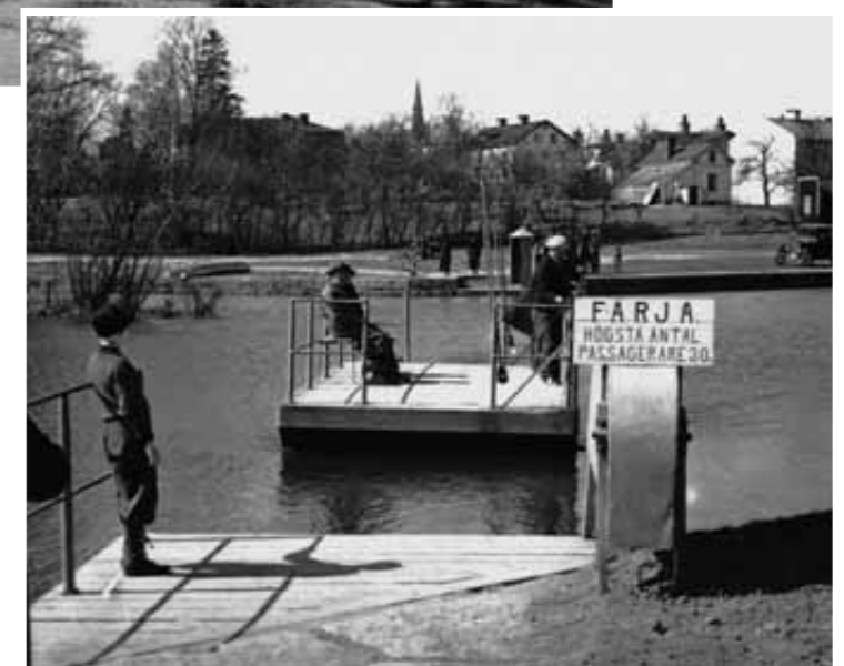
Fotografer: Övre: Olle Arpfors, 1965, undre: Folke Fromholtz Färjorna över Kinda Kanal/Stångån vid Pumpgatan och vid Tinnerbäckens utlopp. Tinnerbäcken.

Utställningen är finansierad av Westman-Wernerska stiftelsen och sammanställd av AB Kinda Kanal i samarbete med: