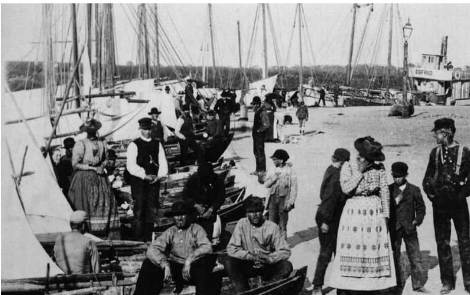
omkr. sekelskiftet 1900 Ett ögonblick av hamnlivet. Båten Sigfrid syns i bakgrunden.