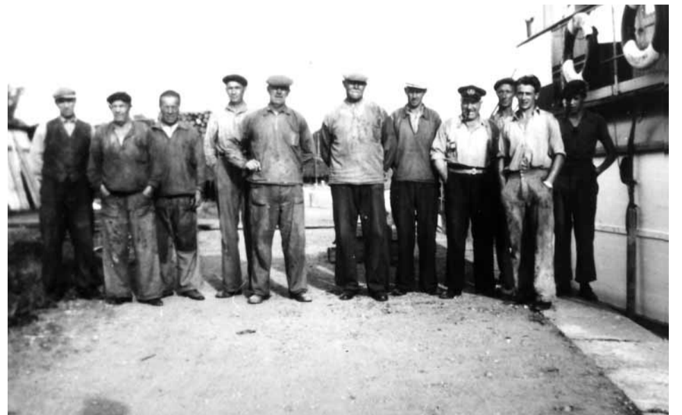
Hamnsjåare tillsammans med Kindas besättning i Linköpings hamn.

Utställningen är finansierad av Westman-Wernerska stiftelsen och sammanställd av AB Kinda Kanal i samarbete med: