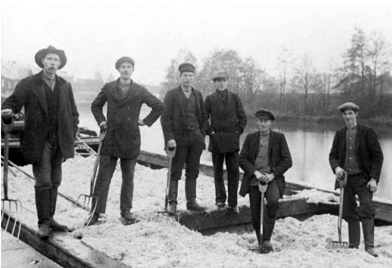
Körning av betmassa från sockerbruket.